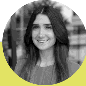
Miriam Becker Universitätsbibliothek - Universität der Bundeswehr München