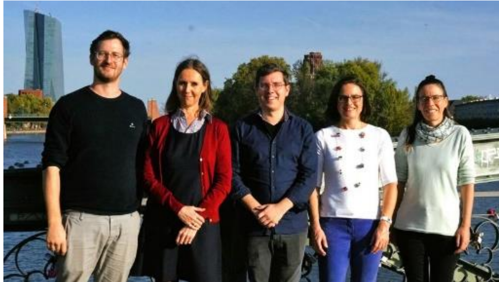
Manuel Brandt Stadtbibliothek Hanau