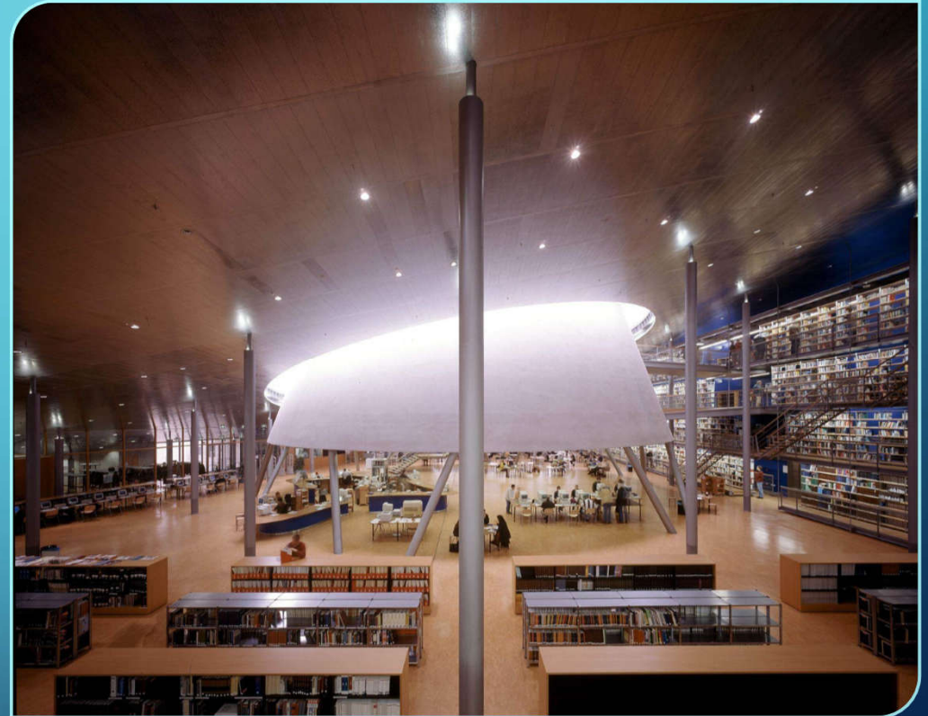
University Library Delft; NL