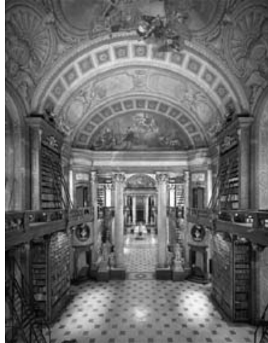
Der Prunksaal der Österreichischen Nationalbibliothek Wien

Die strukturelle Veränderung der ÖNB wurde als Chance genutzt, die Öffentlichkeitsauftritte zu professionalisieren und bestehende Förderstrukturen stärker zu vernetzen.