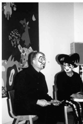
Der Vorstand des Freundeskreises liest Geschichten aus der Zirkuswelt

In diesem Zusammenhang sind auch die Exkursionen zu erwähnen, die der fsh als Veranstalter oder Mitveranstalter anbietet, bislang ausnahmslos zu Orten, die einen Buch-, Medien- oder Literaturbezug aufweisen, darunter neben vielen anderen Fahrten zur Frankfurter und Leipziger Buchmesse.