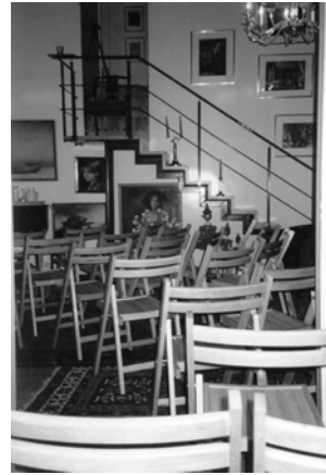
Arbeiten von Hammer Künstlern in der Zentralbibliothek

Diese Fördertätigkeit im engeren Sinne bedürfte eines Fördervereins nicht zwingend, da auch die Stadtbüchereien Hamm selbst als gemeinnützige Einrichtung anerkannt sind; die Mehrzahl der potentiellen Geldgeber jedoch entscheidet sich – wohl eher aus psychologischen Gründen – gegen eine zweckgebundene Spende auf das Konto der Stadt und für eine Spende an den Förderverein.