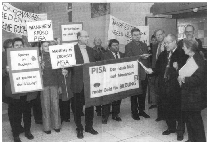
Pressewirksam: Protest gegen Kürzungen bei den Bibliotheken

Bei den meist zweijährlich stattfindenden Haushaltsberatungen des Gemeinderats leisten die Mitglieder des Vorstandes und des Kuratoriums wertvolle Lobbyarbeit. Gemeinsam mit den Fördervereinen der Zweigstellen werben sie durch Briefe sowie Gespräche mit dem Oberbürgermeister und den Stadträten für die Arbeit in den Bibliotheken und organisieren ggf. auch aufsehenerregende und symbolträchtige Aktionen, mit denen sich die Stadtbibliothek bei den Entscheidungsträgern und in der Bevölkerung bis in buchferne Kreise hinein bekannt gemacht hat und ihr Ansehen nachhaltig verbessern konnte.