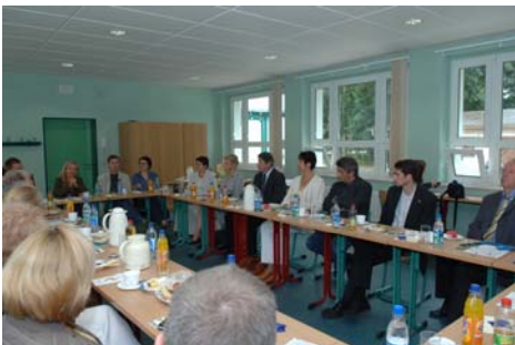
Gesprächsrunde des Arbeitskreises Bildung im Deutsch-Polnischen Gymnasium Löcknitz.