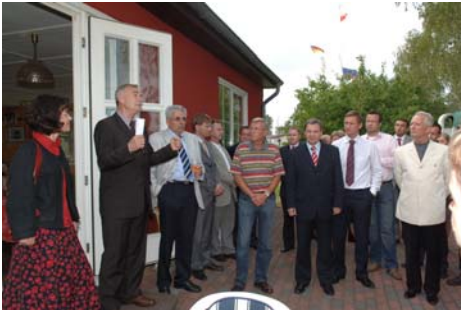
Vizeministerpräsident Jürgen Seidel spricht zu den über 90 Gästen des CDU-Sommerfestes.