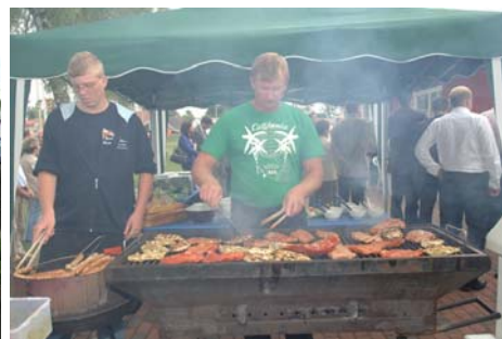
Eine Menge zu tun gab es für das Grillteam vom Yachtclub Ueckermünde.