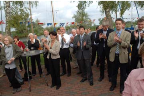
Gutes Wetter sorgte für gute Stimmung beim Sommerfest der CDU-Landtagsfraktion.