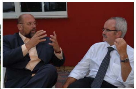
Harry Glawe und Werner Kuhn (MdL und Präsident des DRK Mecklenburg-Vorpommern diskutieren über die jüngsten familienpolitischen Entlastungen der Großen Koalition in Schwerin.