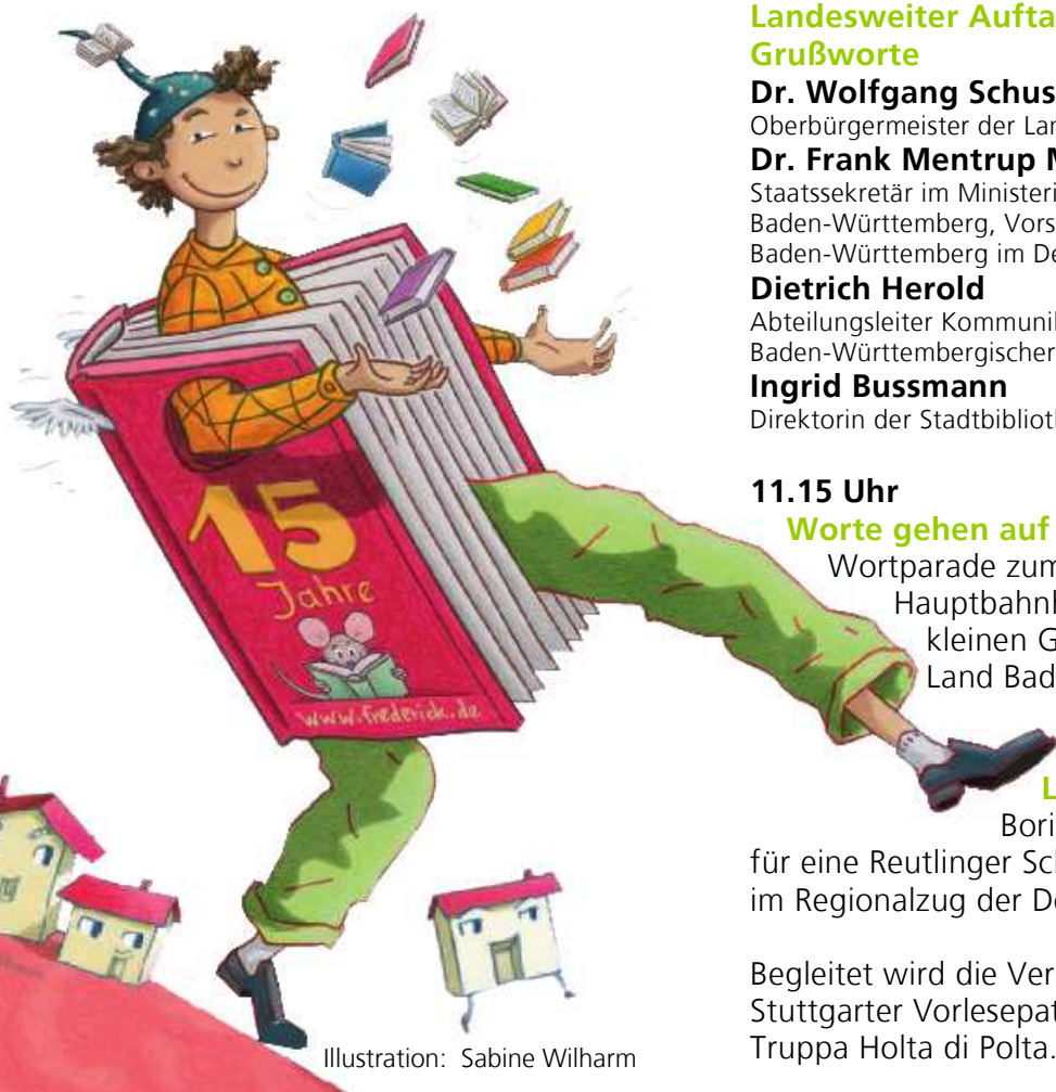
Illustration: Sabine Wilharm

Die Stadtbibliothek Stuttgart, das Ministerium für Kultus, Jugend und Sport Baden-Württemberg und der Landesverband Baden-Württemberg im Deutschen Bibliotheksverband laden im Rahmen des 15. landesweiten Literatur-Lese-Festes „FrederickTAG“ zur zentralen Auftaktveranstaltung in die Stadtbibliothek Stuttgart herzlich ein!